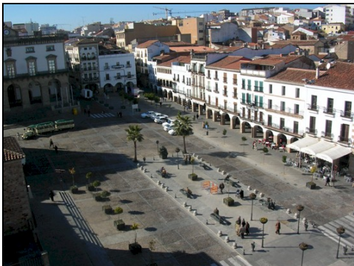
Blicke auf die Plaza Mayor

In Cáceres angekommen kann man vom Busbahnhof aus mit den Buslinien 4 und 8 in die Stadt fahren. Einfacher ist aber, ein Taxi zu nehmen. Eine Fahrt bis zur Stadtmitte kostet meist etwas weniger als 5 Euro. Wenn vor dem Busbahnhof keine Taxen warten, kann man unter 927212121 eines bestellen, muss nur dabei meistens seinen Namen angeben.