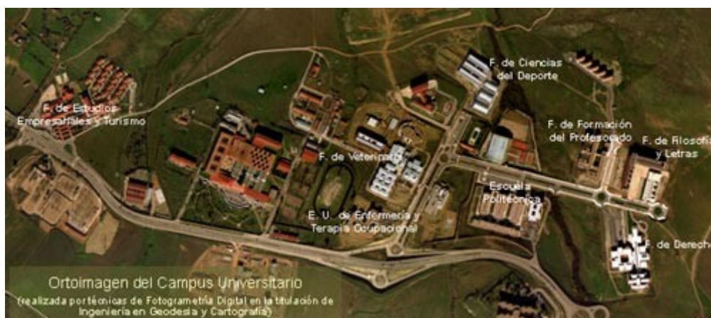
Übersichtsplan des Campus in Cáceres

Die Uni in Cáceres wurde im Jahr 1973 gegründet und war zunächst am Rande der Innenstadt angesiedelt. Mit den heute mehr als 10.000 Studenten wurde der gesamte