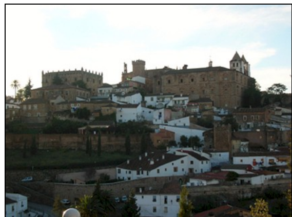
Blick auf die Altstadt von Cáceres

Im malerischen Altstadt kern findet man außerdem weitere Verteidigungstürme und viele Paläste, die auf die Almohaden-Dynastie - die Berberdynastie, die sich in Andalusien niederließ – zurückgehen. Zahlreiche Kirchen und die malerische Plaza Mayor komplettieren die Stadt, die 1986 von der UNESCO zum Patrimonio de la Humanidad , zum Weltkulturerbe erklärt wurde.